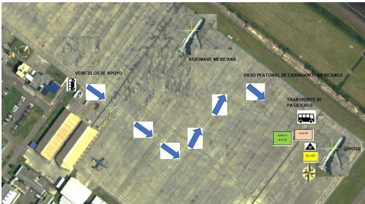
Figura 2. Diagrama de ubicación de la aeronave en tierra, zona amarilla para retiro de EPP