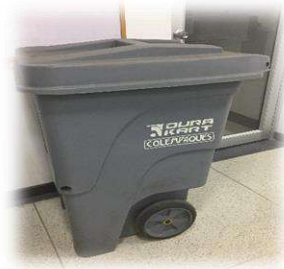
Figura 3. Contenedor en área amarilla