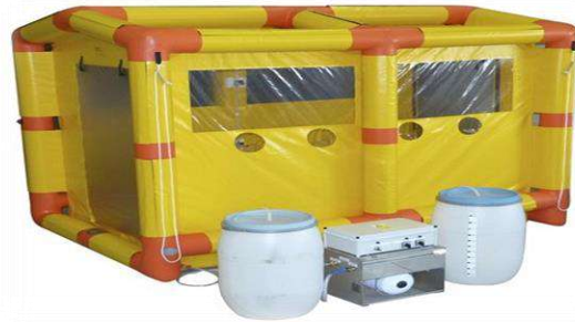
Figura 1. Cabina para retiro de EPP

Área de equipaje: zona designada para dejar el equipaje, desinfectarlo. Solo podrán retirarlo después del proceso de retiro de EPP y desinfección adecuada de manos.